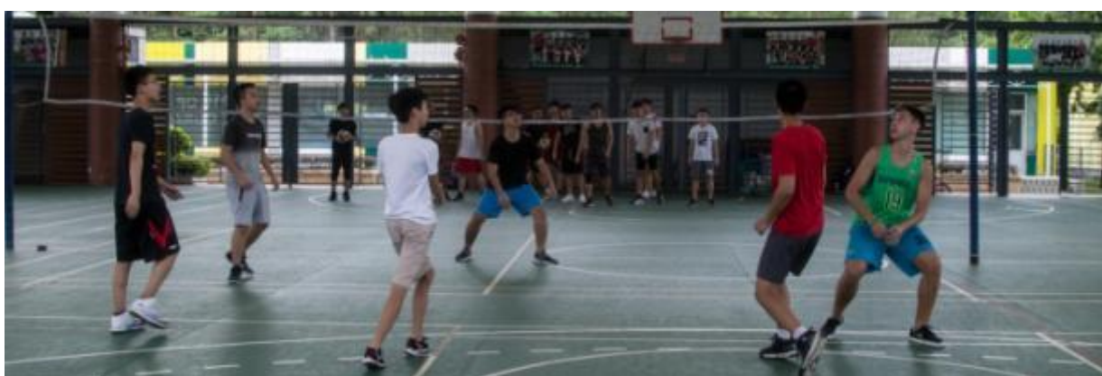
Boys Volleyball practice