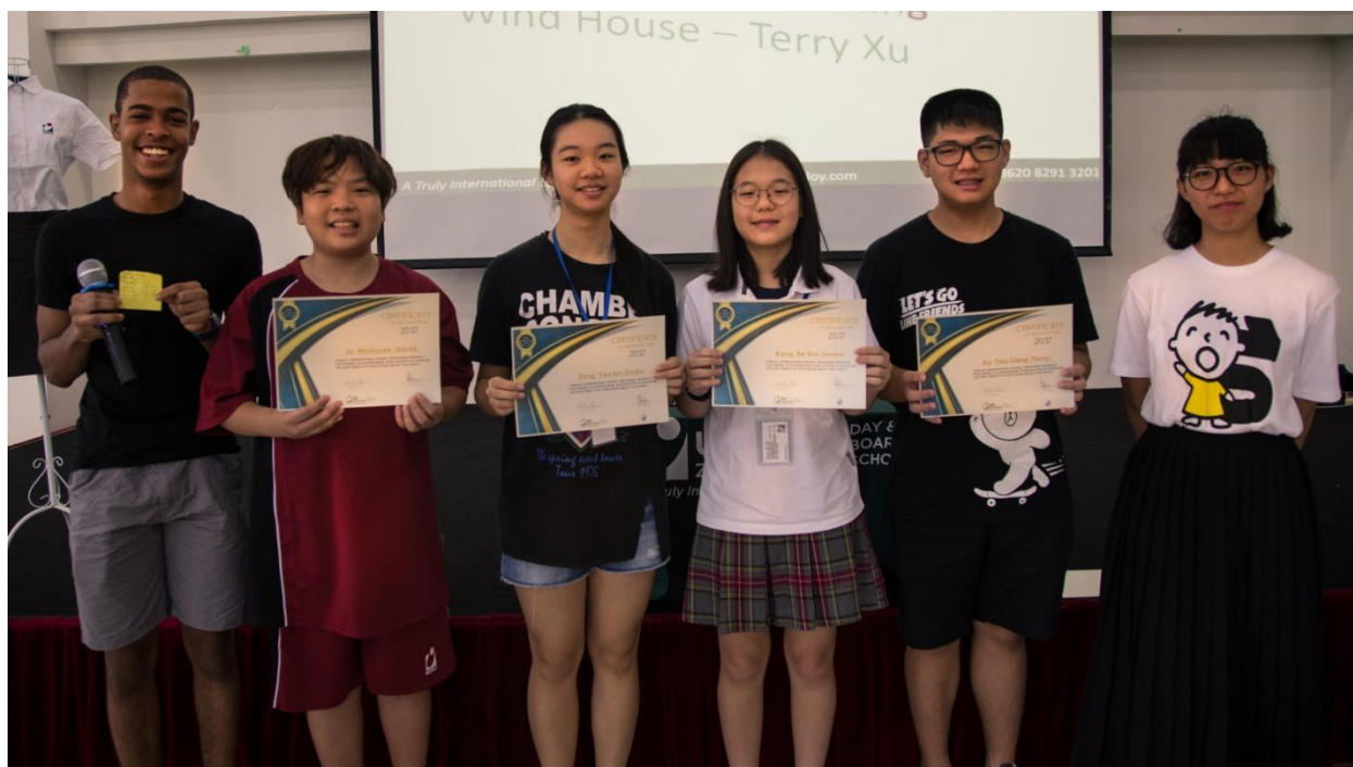
8月份的获奖学生们

颁奖典礼给了我们一个非常好的机会，让我们可以庆祝学生们这一段时间以来所取得的进步和良好成绩。我们颁发的奖项包括了在每一个学生小组里获得最高奖励点的学生，本月获得调查者这个学习者特征的学生，以及对于表现优秀的学生会会长所给予的肯定。个别的老师也会在此颁奖典礼上表扬个别的表现突出的，并且获得老师积极评价的学生。8月份获得4个学生小组最高奖励的学生分别是：