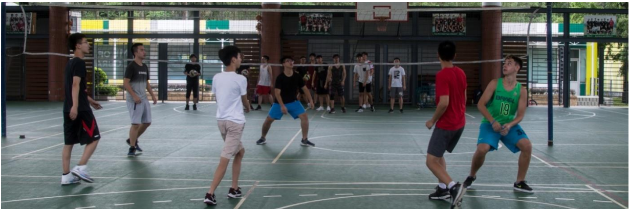
남자 배구 연습