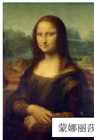
蒙娜丽莎 – 达芬奇