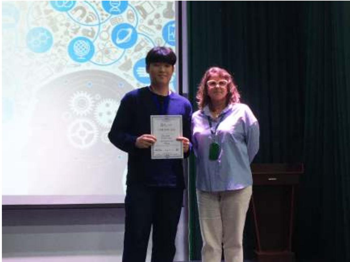
최다 칭찬 점수상 수상 학생