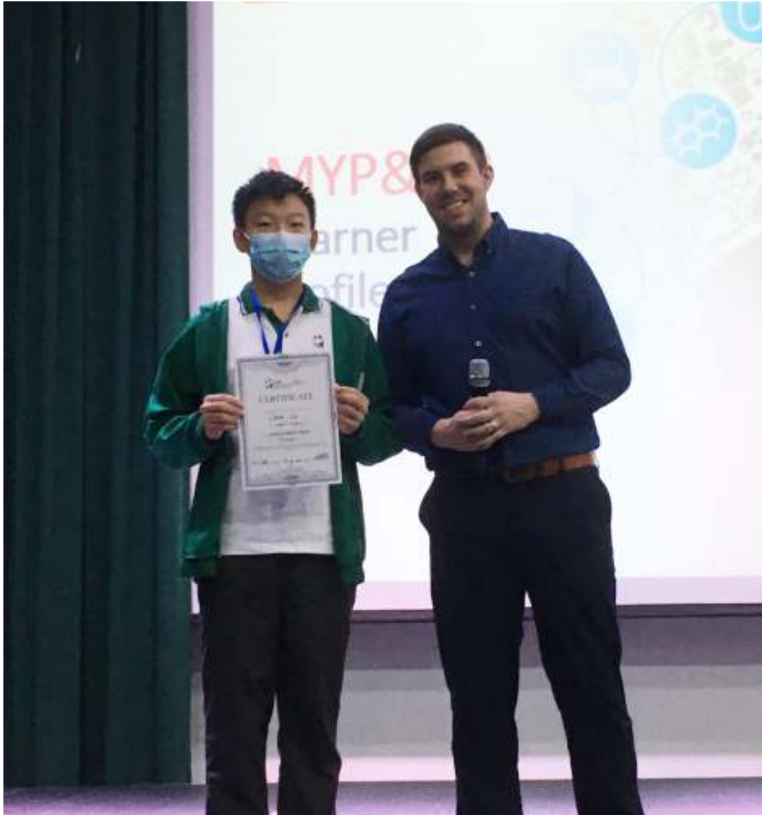
DP 학습자 프로파일 상 수상 학생