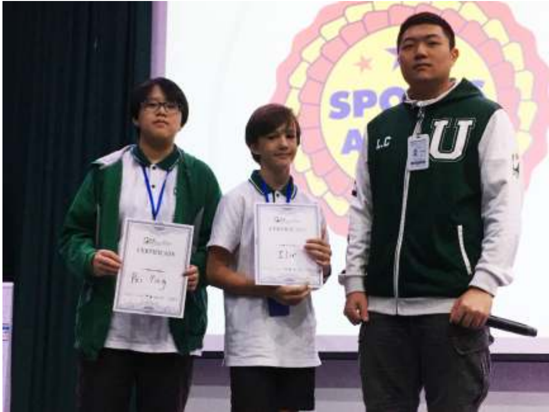
기숙사 상 시상자들