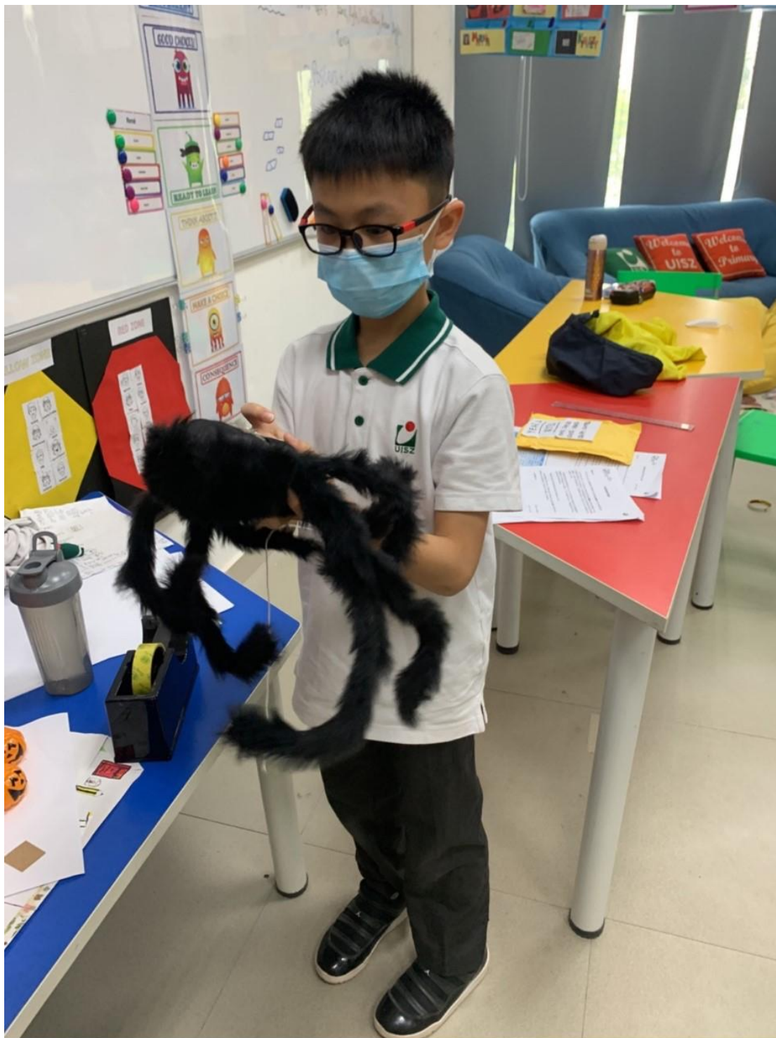
中学项目 来自 Tiffany 老师的信息