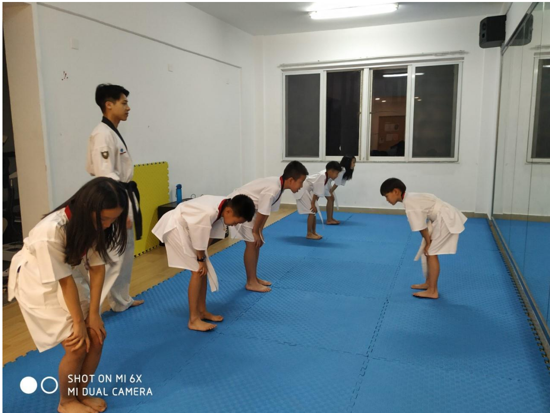
SHOT ON MI 6X MI DUAL CAMERA