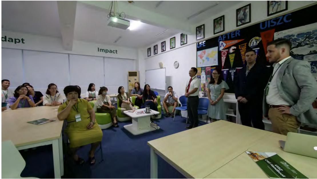
초등학교 학부모 교사 면담