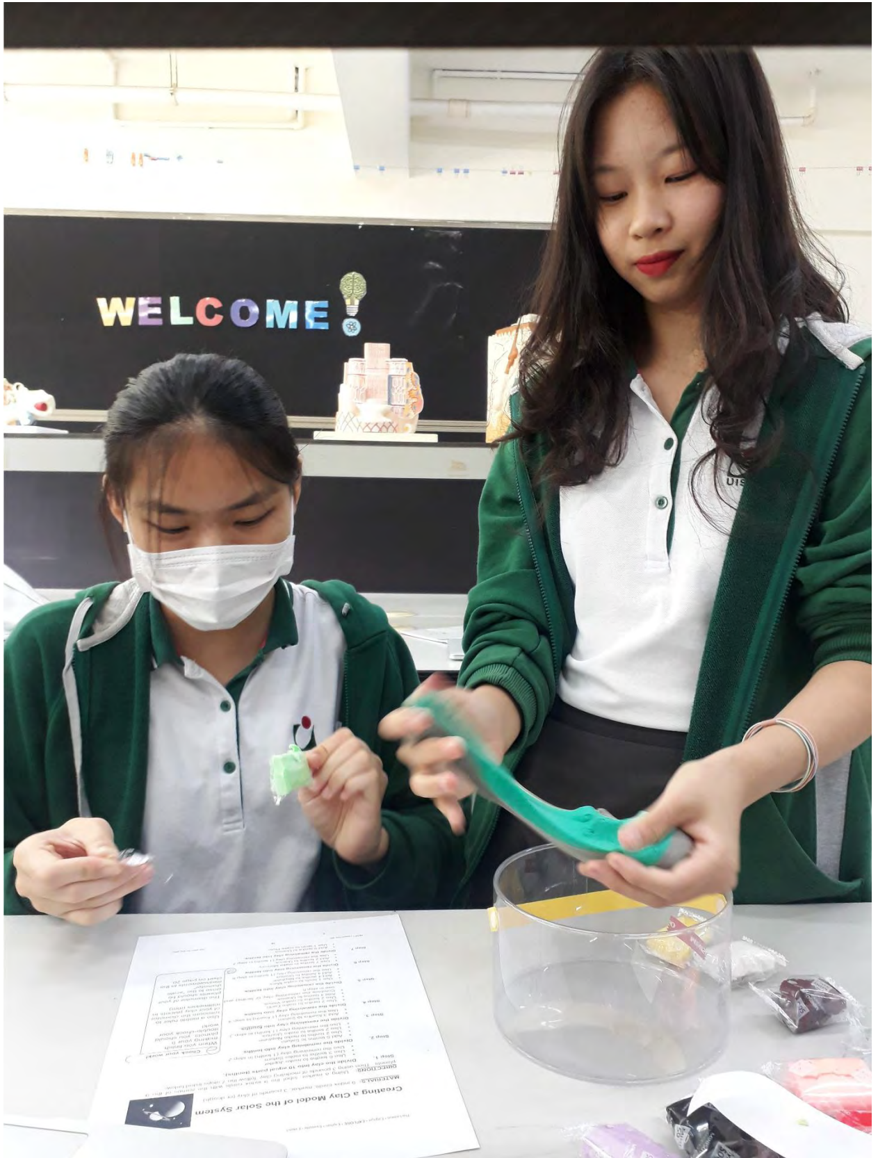
고 매우 놀라워했습니다.