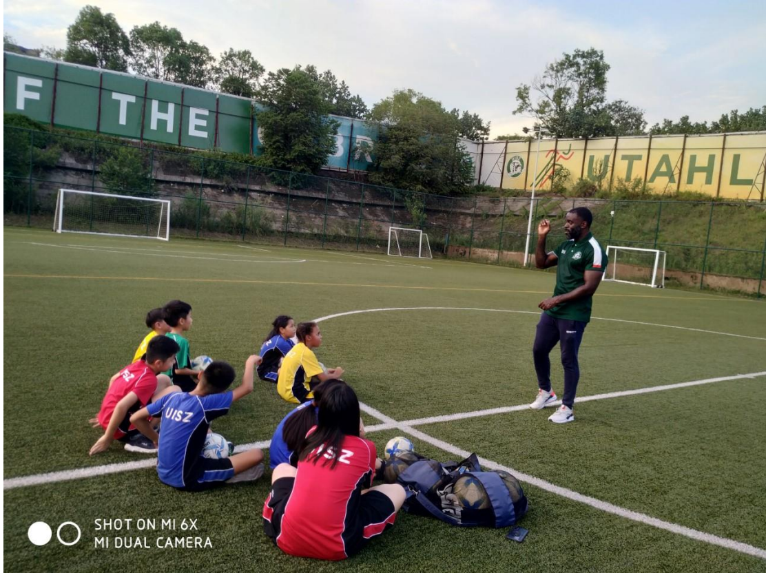
SHOT ON MI 6X MI DUAL CAMERA