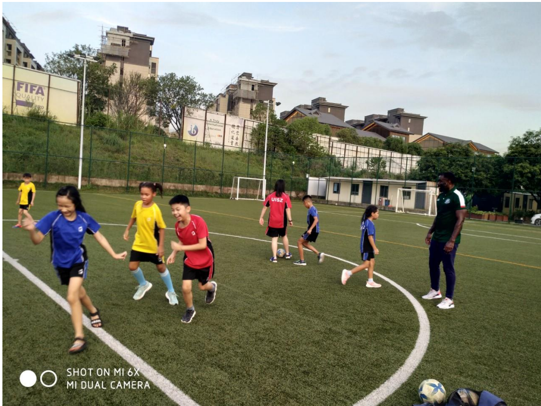
SHOT ON MI 6X MI DUAL CAMERA