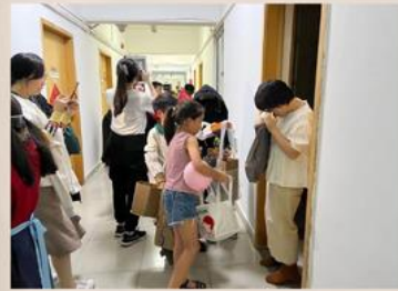
THE STUDENTS VISIT TEACHER'S HOUSE FOR TRICK OR TREATS