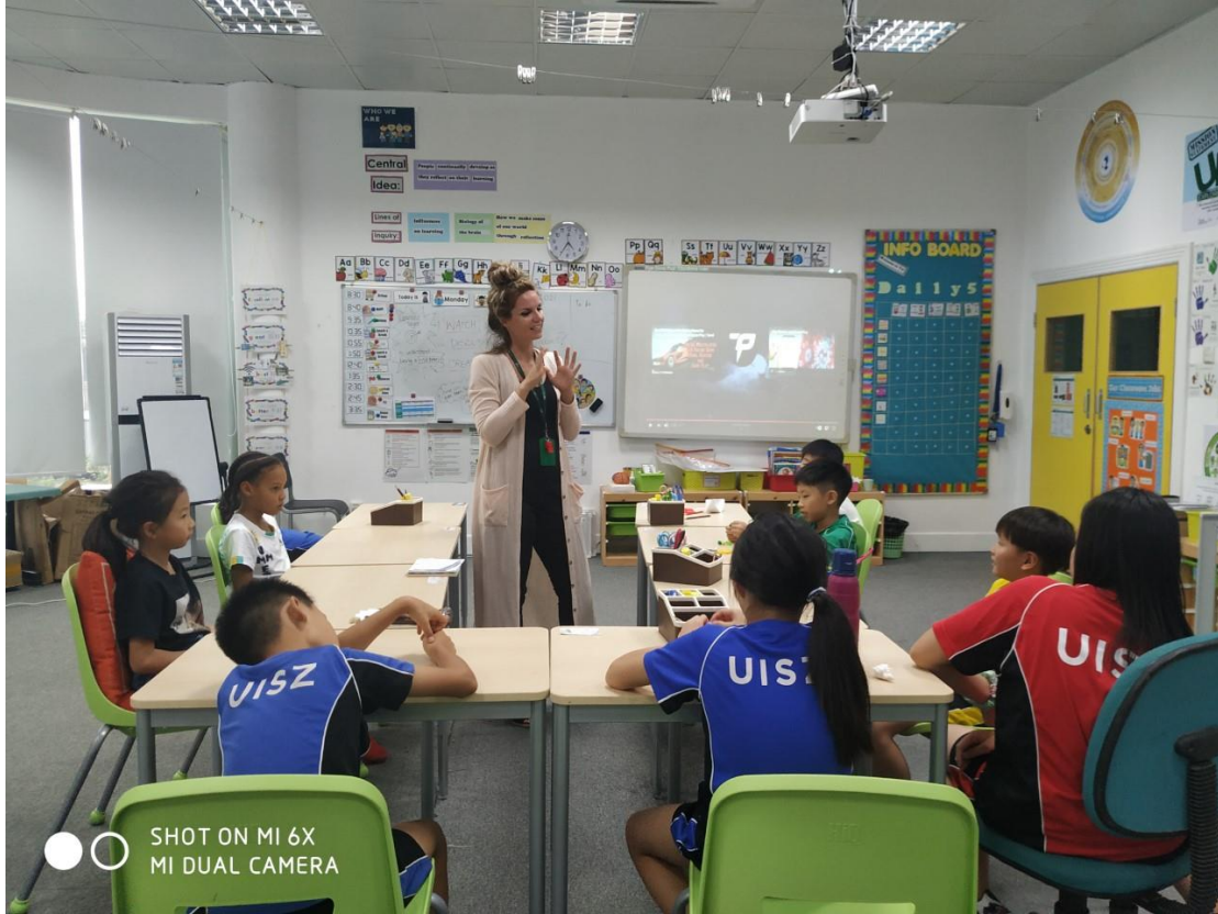
SHOT ON MI 6X MI DUAL CAMERA