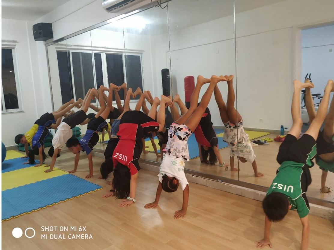
SHOT ON MI 6X MI DUAL CAMERA