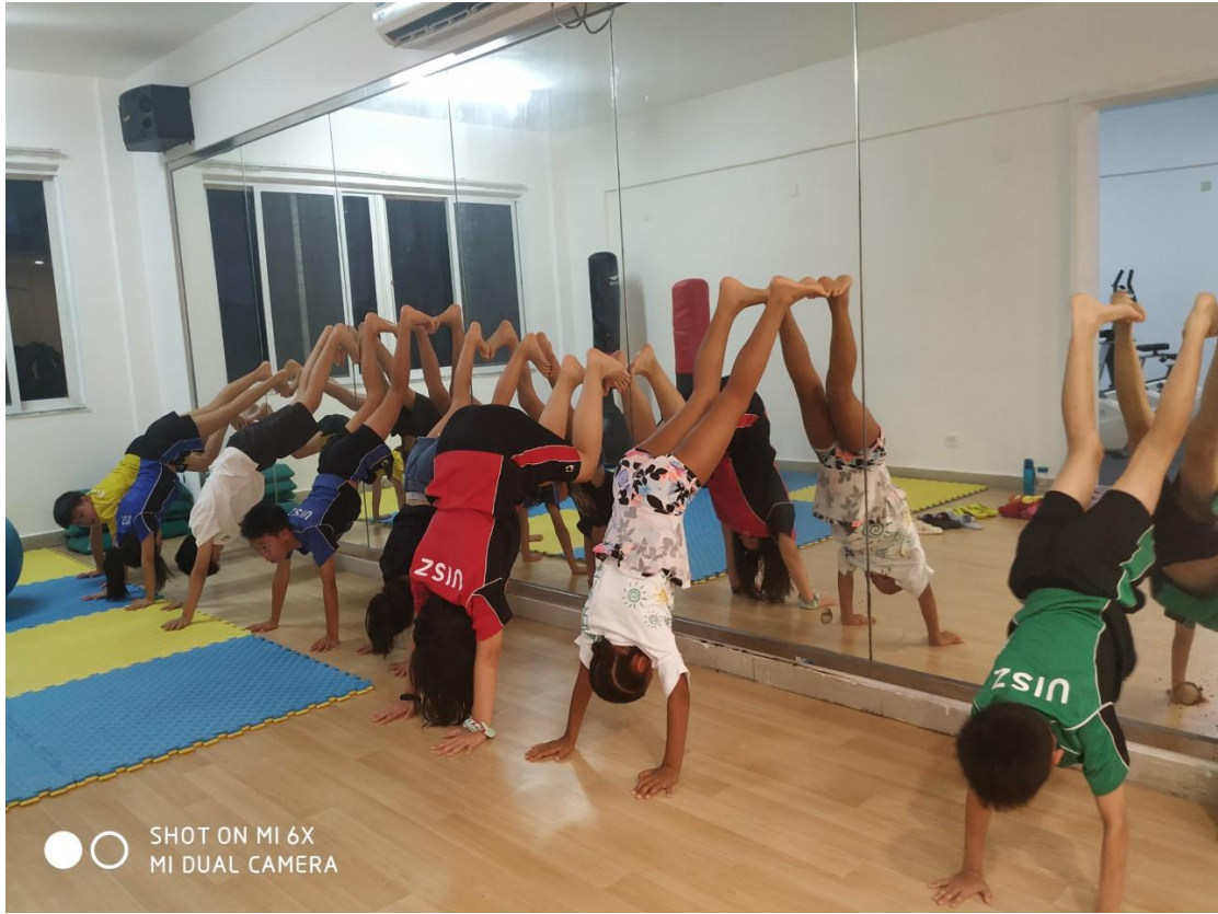
SHOT ON MI 6X MI DUAL CAMERA