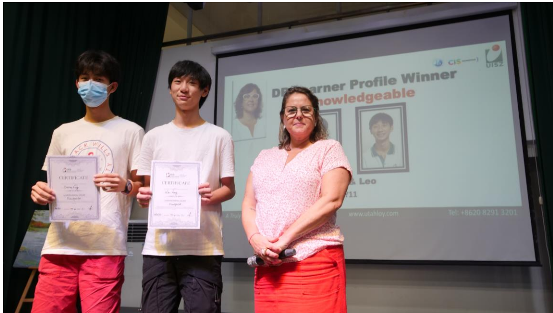
MYP E-Portfolio 2020 证书