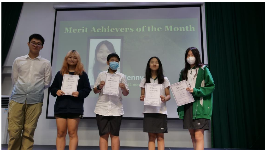
MYP 学生目标奖: 知识渊博