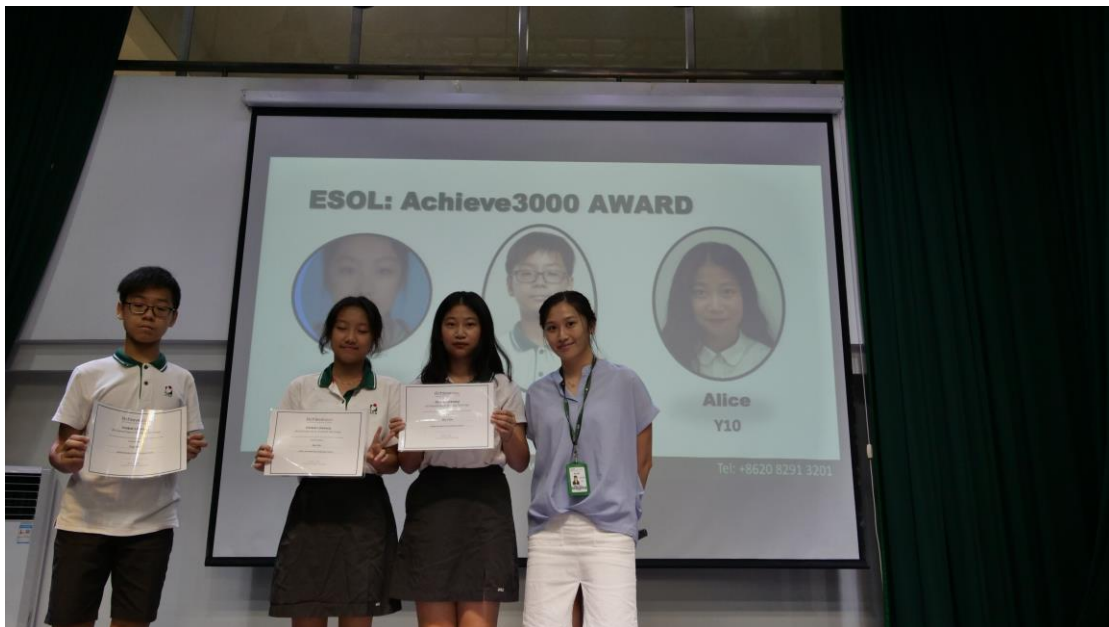
이달의 메리트 어워드