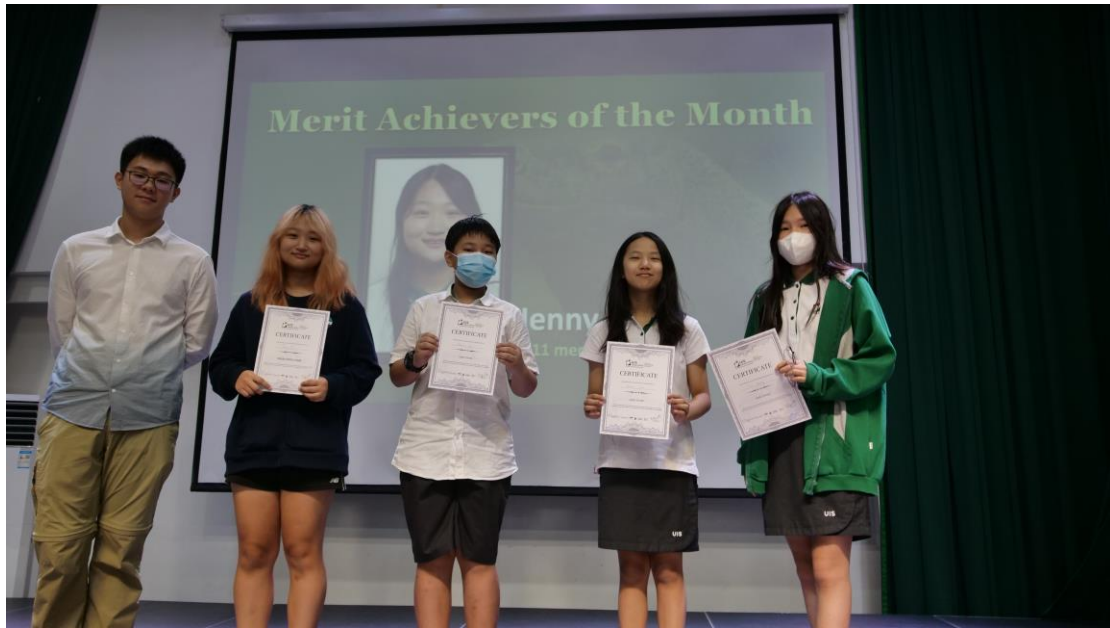
MYP 학습자상 어워드: 지식이 풍부한 사람