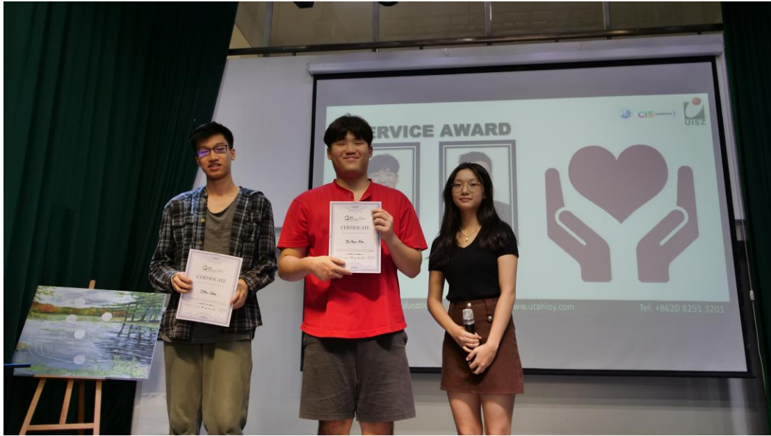
성취 3000 어워드