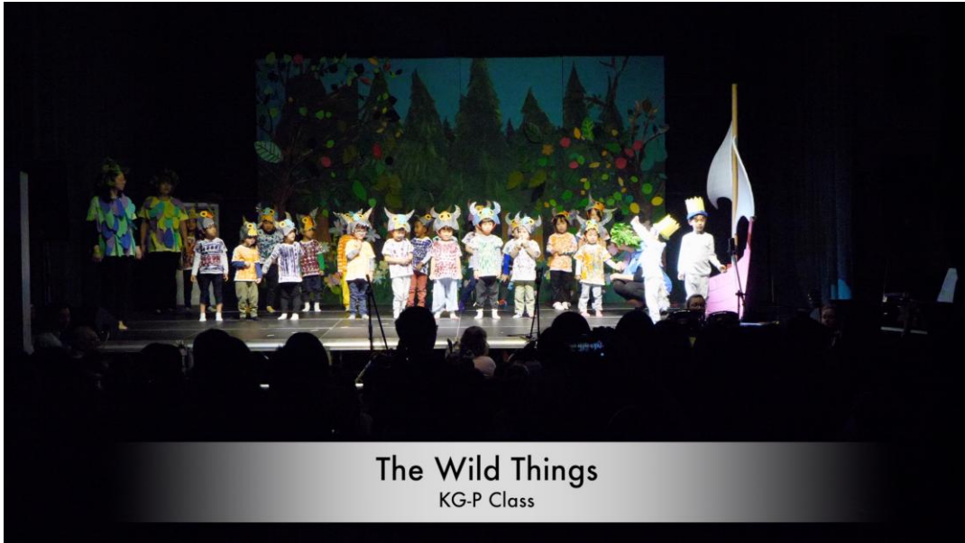
The Wild Things KG-P Class