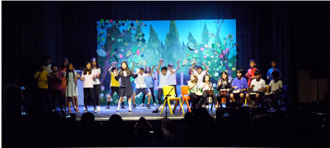
Djole Year 5 & 6