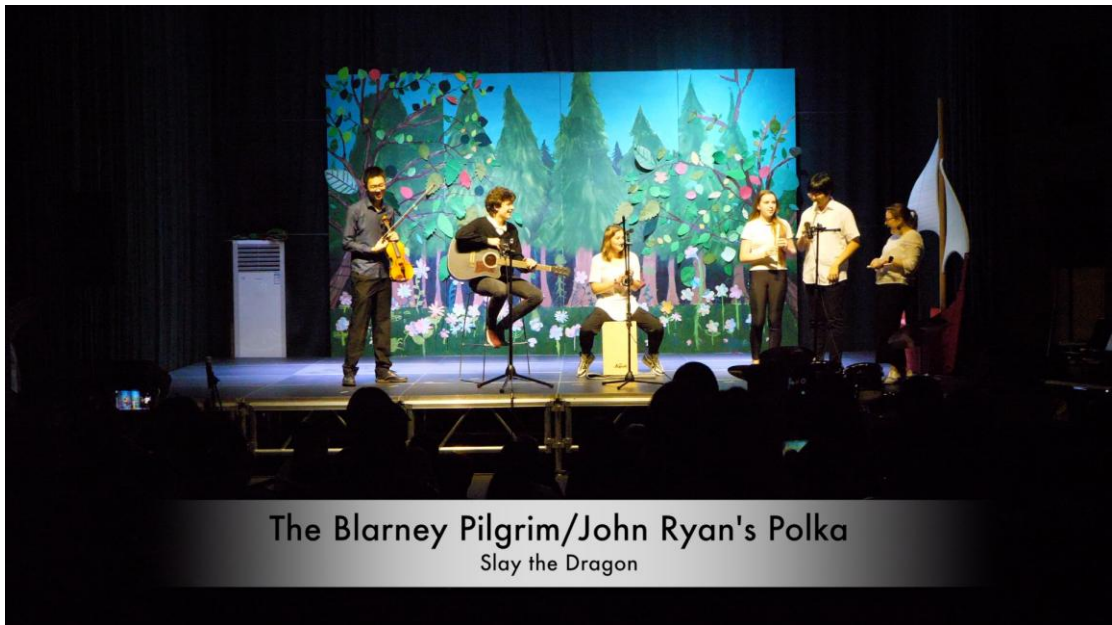
The Blarney Pilgrim/John Ryan's Polka Slay the Dragon