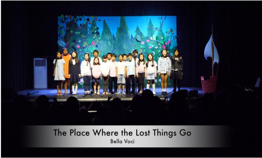
The Place Where the Lost Things Go Bella Voci