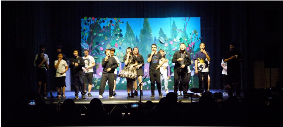
Bills Wind House