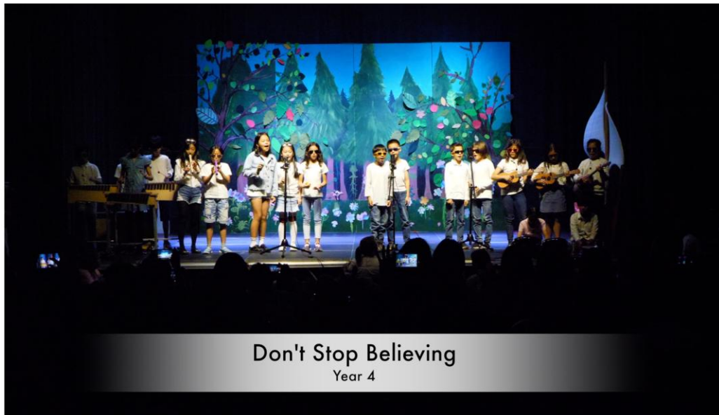
Don't Stop Believing Year 4