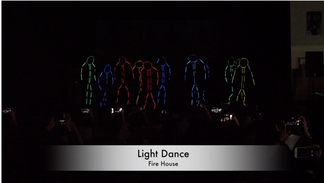
Light Dance Fire House