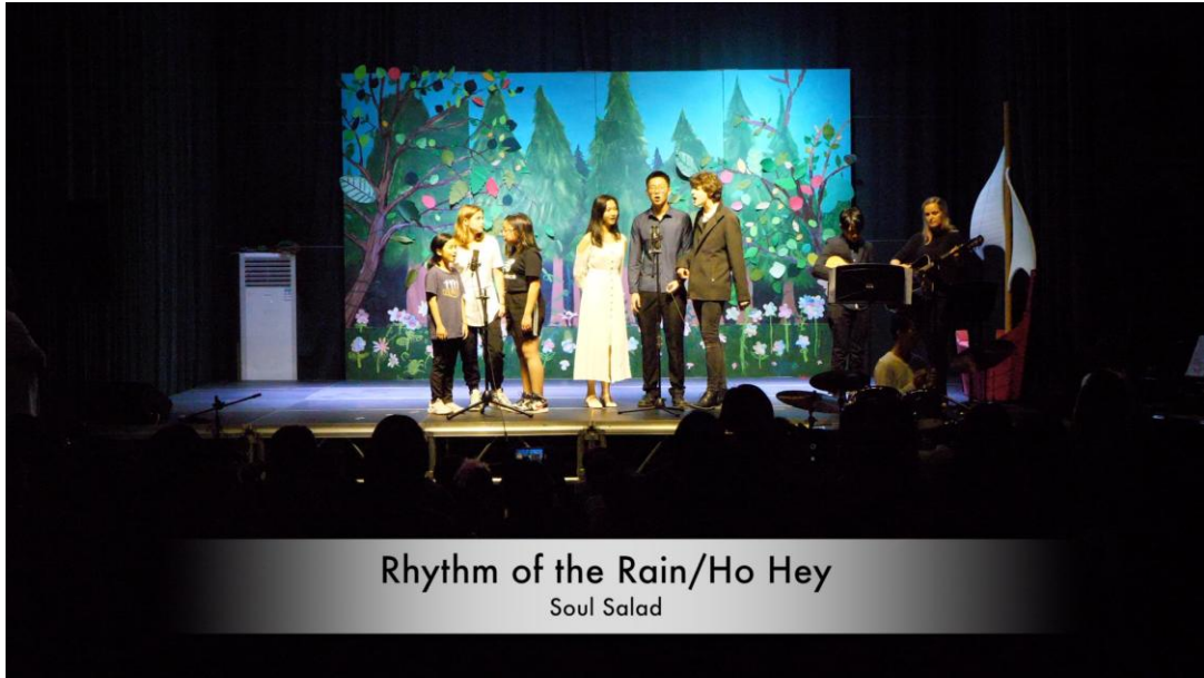
Rhythm of the Rain/Ho Hey Soul Salad