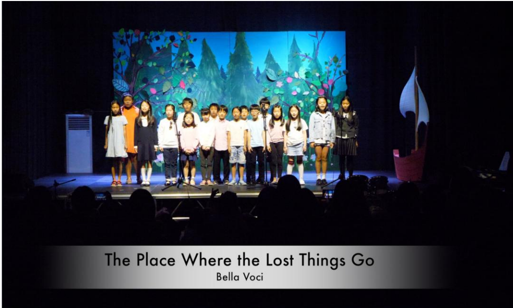
The Place Where the Lost Things Go Bella Voci