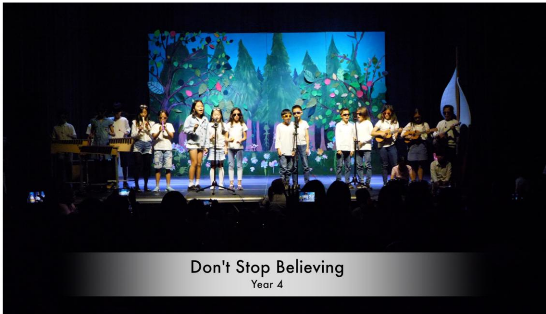
Don't Stop Believing Year 4