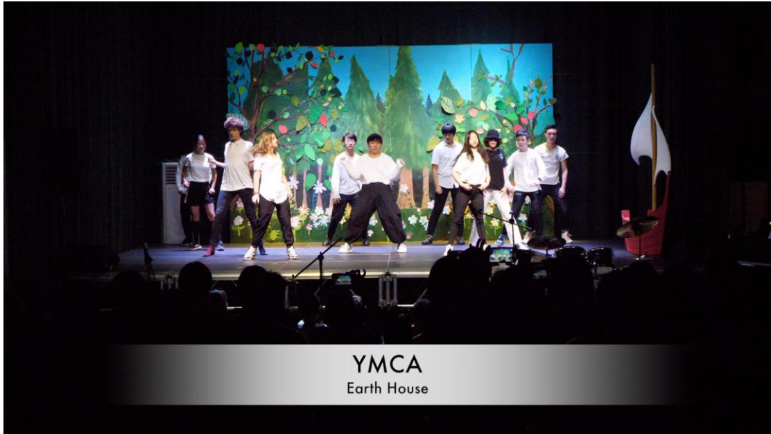
YMCA Earth House