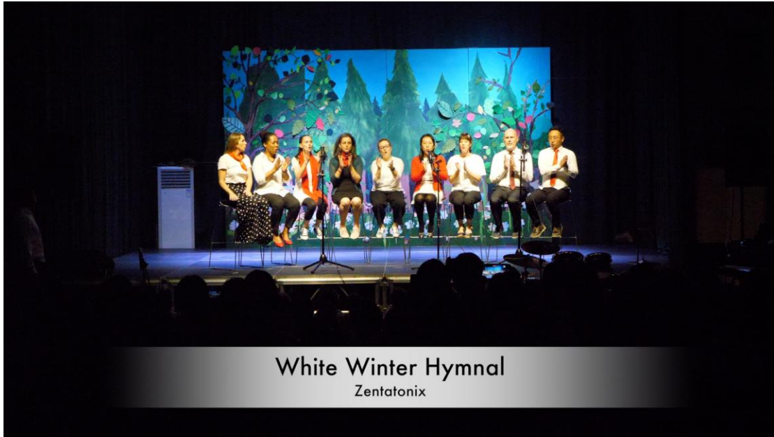
White Winter Hymnal Zentatonix