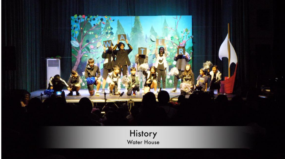
History Water House