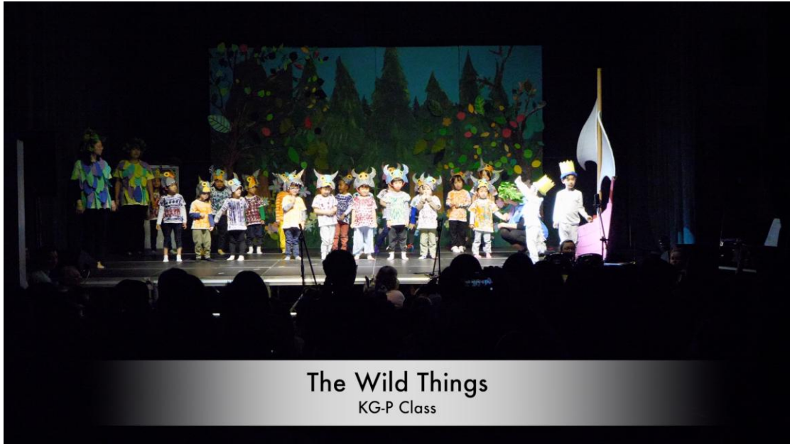
The Wild Things KG-P Class